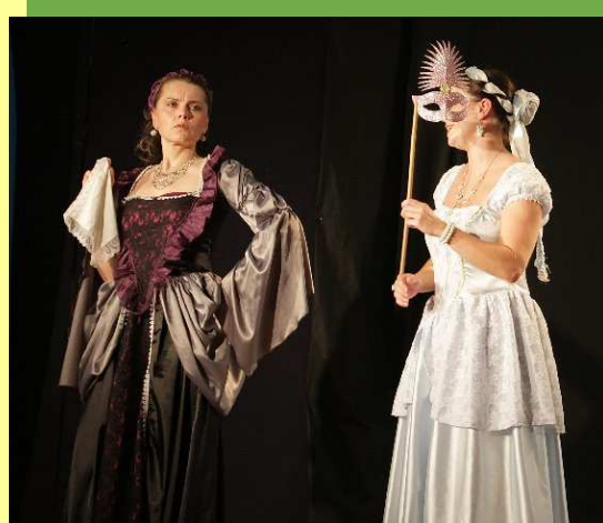
Žena v trysku století Čtvrtek 5. května 19:30