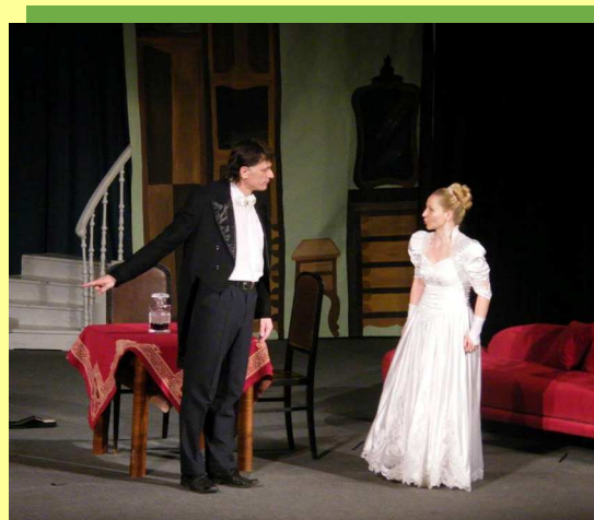
My Fair Lady Neděle 8. května 15:00 a 18:00