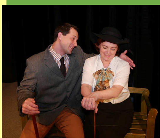
Na letním bytě Středa 4. května 19:30