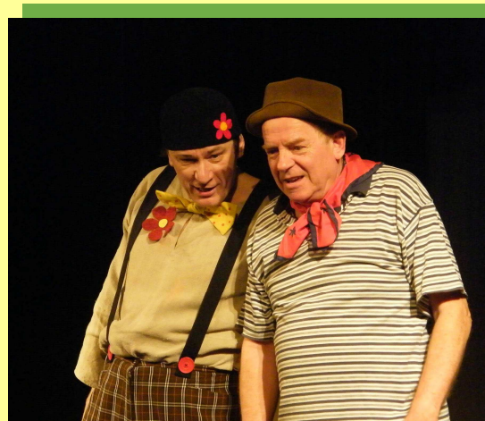
Jízlivý glosátor Dvojprogram Sobota 7. května 19:30